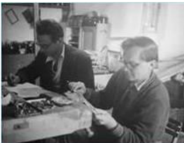
Fotka z r. 1956, nazvaná FYZIKOVÉ

Při zpracování fyzikálního pokusu u stolařské hoblice.